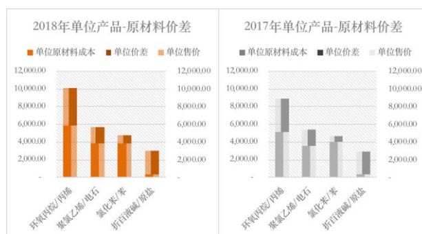
图 主要产品单位价差

在精细化管理、效率创造效益的原则下，公司简化了物资采购流程，推行框架采购，缩短了采购周期，报告期内累计降低采购费用近千万元。