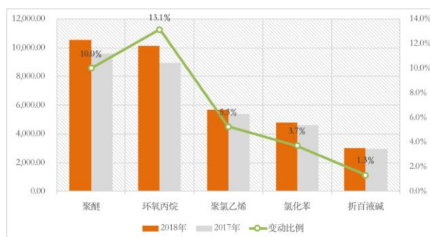
图 主要产品平均售价（单位：元/吨）

报告期内，公司成立销售管理部，并实施更加灵活机动的销售策略，在稳定老客户的同时加大直供客户开发力度，减少中间供应商，扩大利润空间；通过人员优化和新的绩效激励办法，增强业务人员的工作积极性和服务意识，增强客户粘性。报告期内，公司共增加直销客户134家，主要产品的平均售价与上年同期相比均有不同程度的增幅。